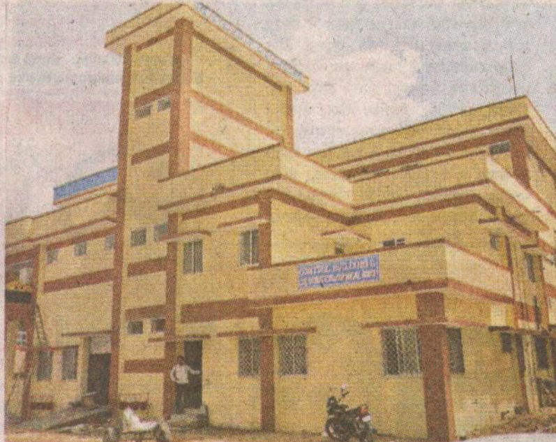
पोकरण कस्बे के बीलिया स्थित हेडवर्क्स पर नवनिर्मित बिल्डिंग, जिसका मुख्यमंत्री लोकार्पण करेंगे।

मुख्यमंत्री करेंगे लोकार्पण : पोकरण-फलसूण्ड लिफ्ट परियोजना का कार्य पूर्ण